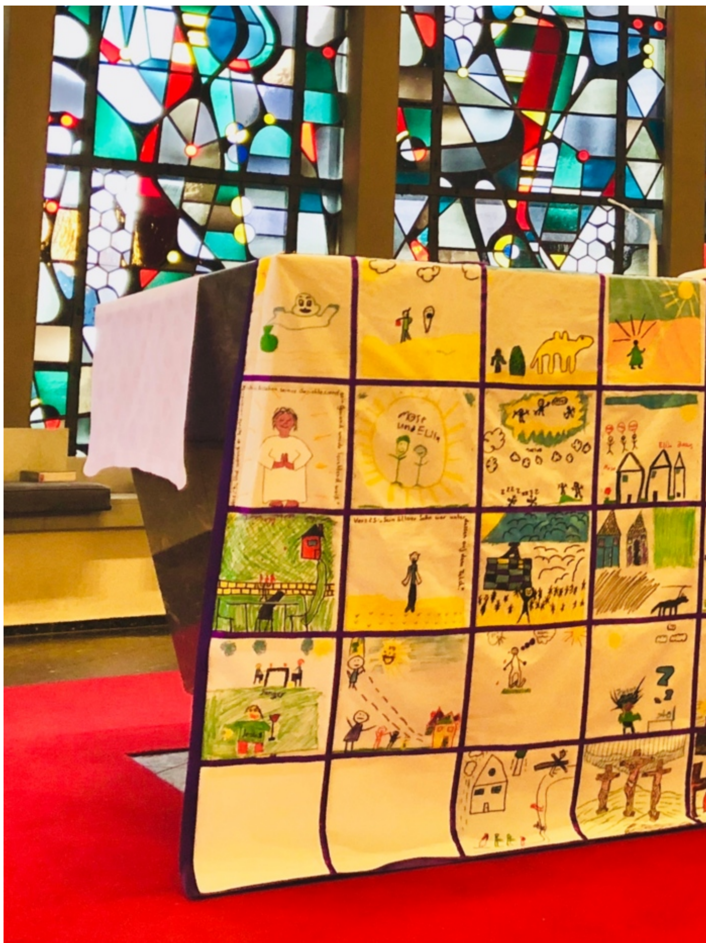
Auf dem Tuch haben die Kinder Szenen aus den Evangelien der Fastenzeit dargestellt. Die Gemeinde war wieder herzlich eingeladen, nach der Messe die Gelegenheit zu nutzen, nahe an das Fastentuch heranzutreten und die einzelnen Szenen darauf genauer zu betrachten.