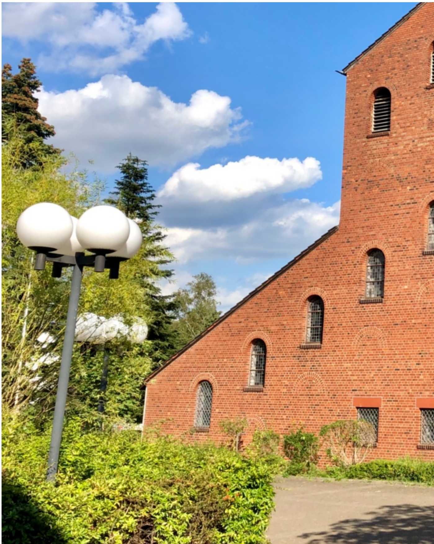
Kirchort St. Elisabeth, Deichhaus ( https://www.servatius-siegburg.de/kirchorte/kirche-sankt-elisabeth/ )