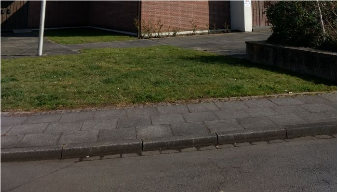
Kirchort St. Hedwig, Zange ( https://www.servatius-siegburg.de/kirchorte/kirche-sankt-hedwig/# )