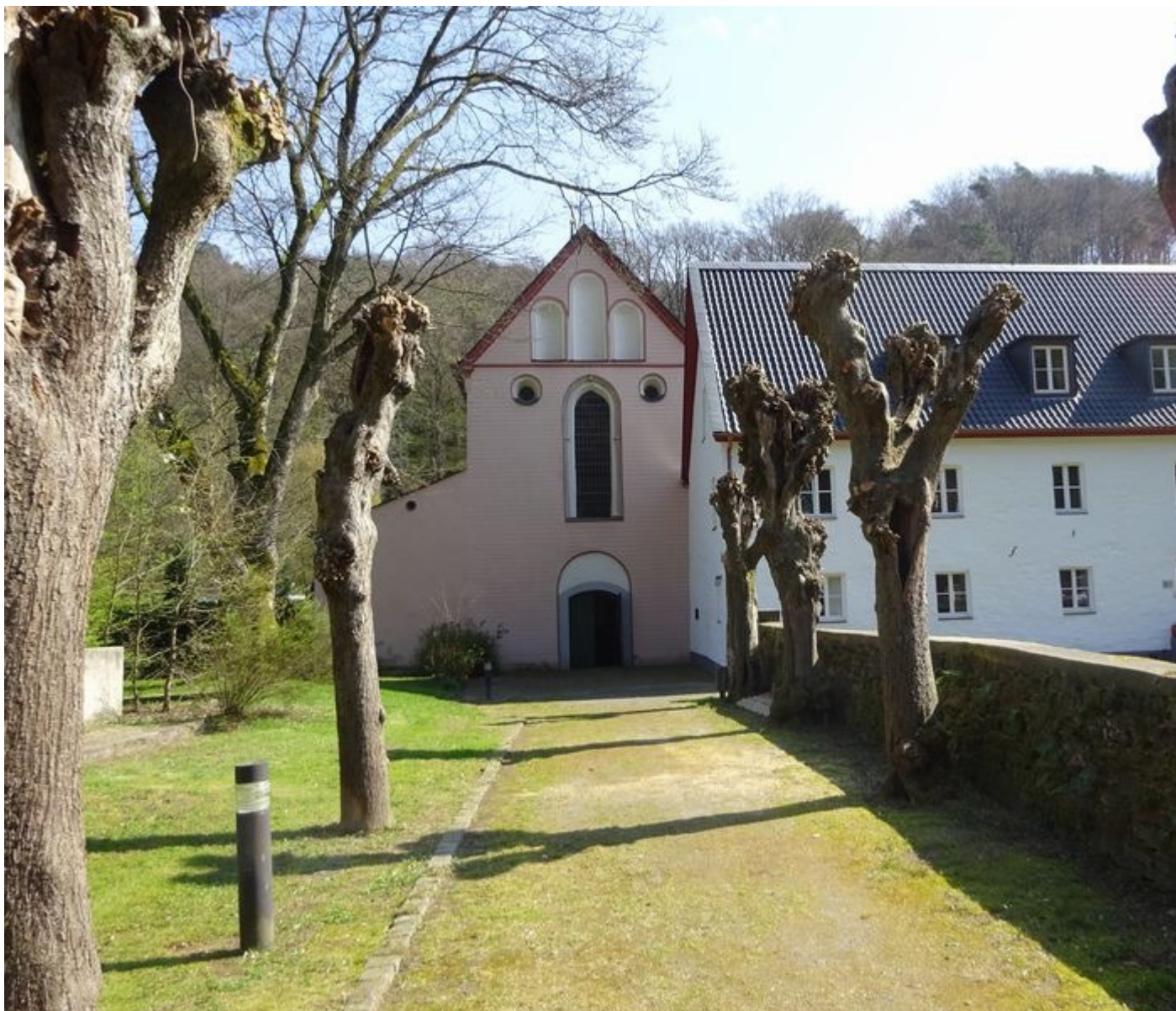
Kirchort St. Antonius, Seligenthal ( https://www.servatius-siegburg.de/kirchorte/kirche-sankt-antonius/ )