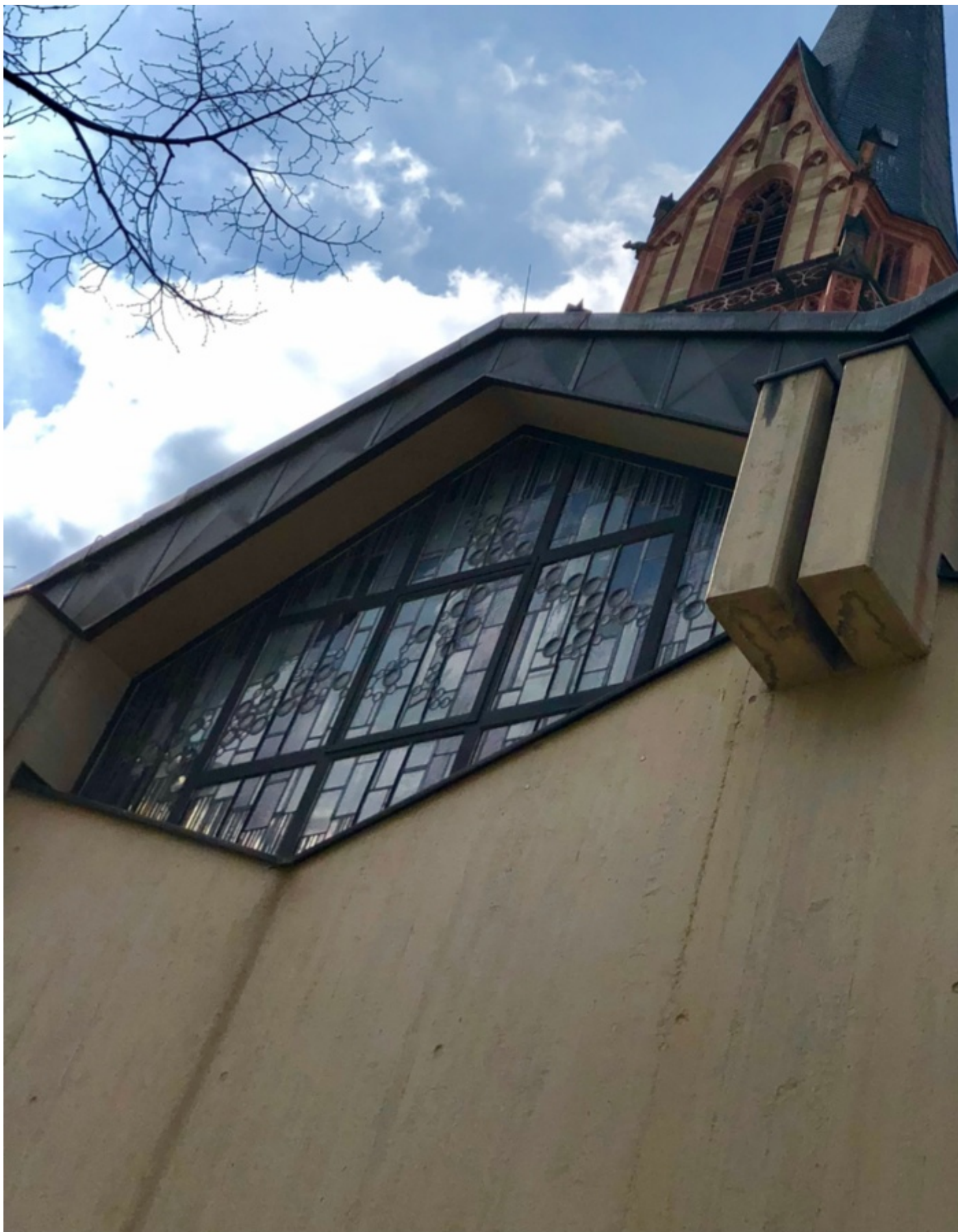
Kirchort St. Anno, Nordstadt ( https://www.servatius-siegburg.de/kirchorte/kirche-sankt-anno/ )