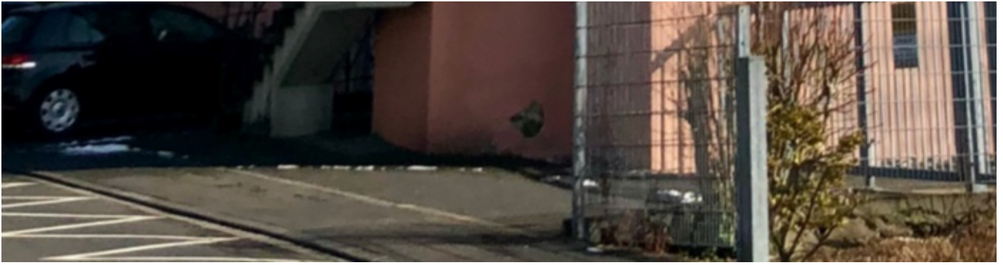
Kirchort St. Dreifaltigkeit, Wolsdorf ( https://www.servatius-siegburg.de/kirchorte/kirche-sankt-dreifaltigkeit/ )