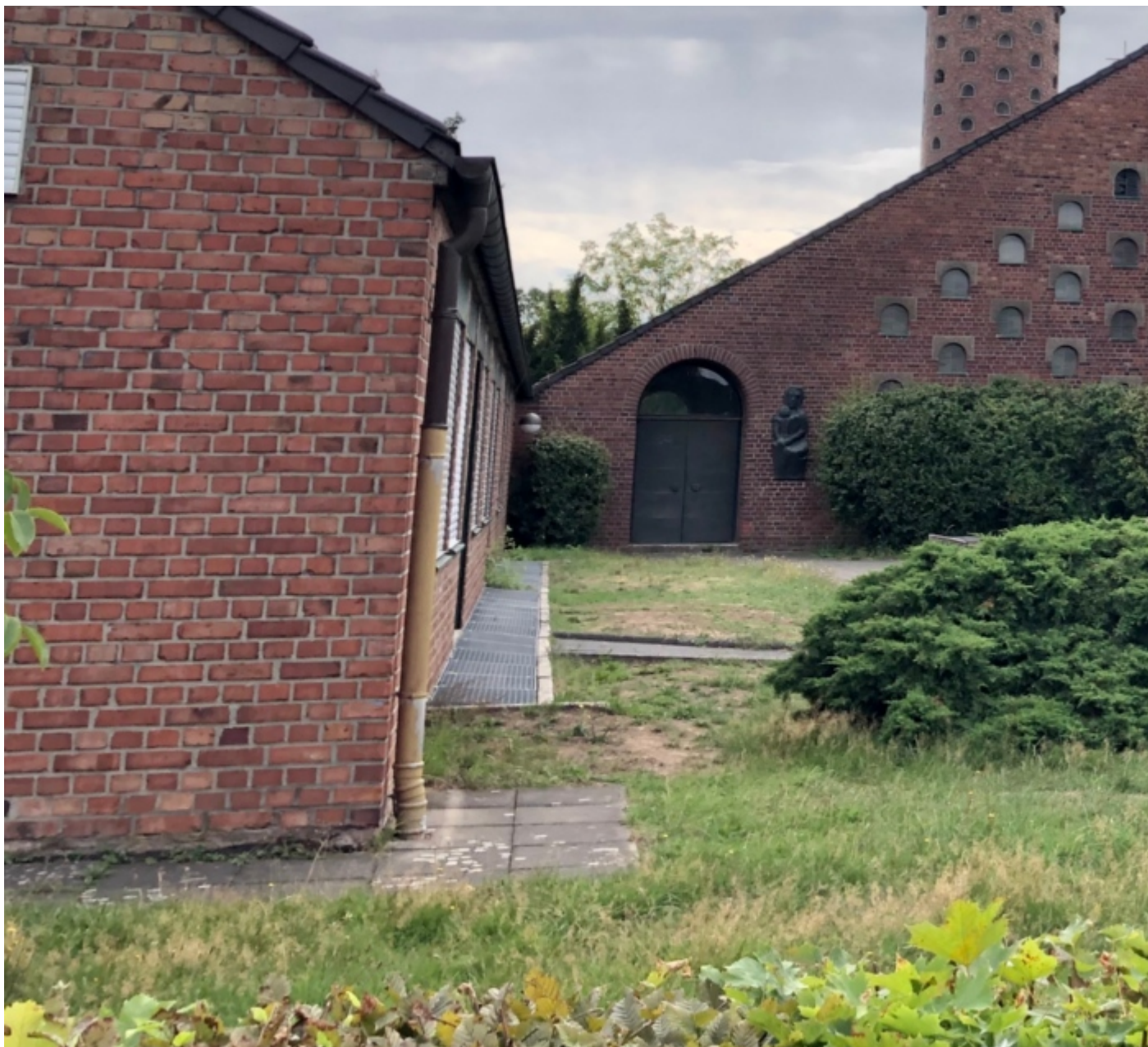
Kirchort St. Joseph, Brückberg ( https://www.servatius-siegburg.de/kirchorte/kirche-sankt-joseph/ )