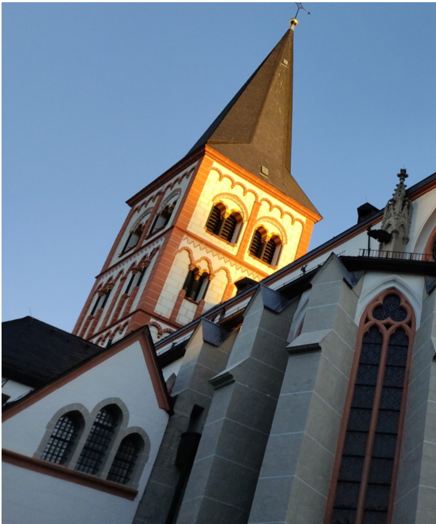
Kirchort St. Servatius, Innenstadt ( https://www.servatius-siegburg.de/kirchorte/pfarrkirche-sankt-servatius/ )