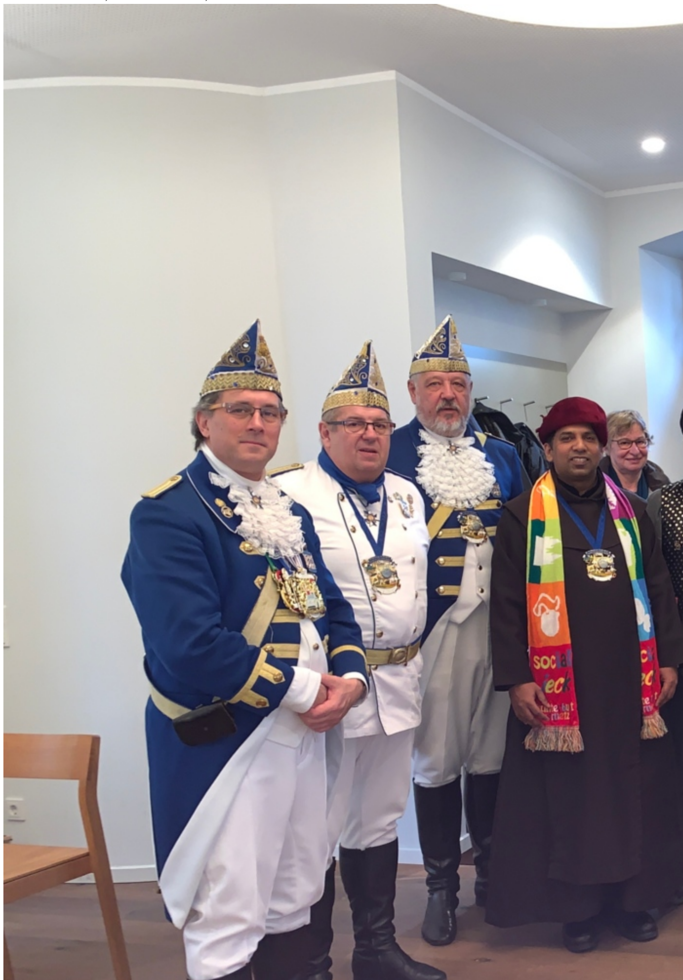
Sieburch alaaf, Karmel alaaf, blau weiß alaaf