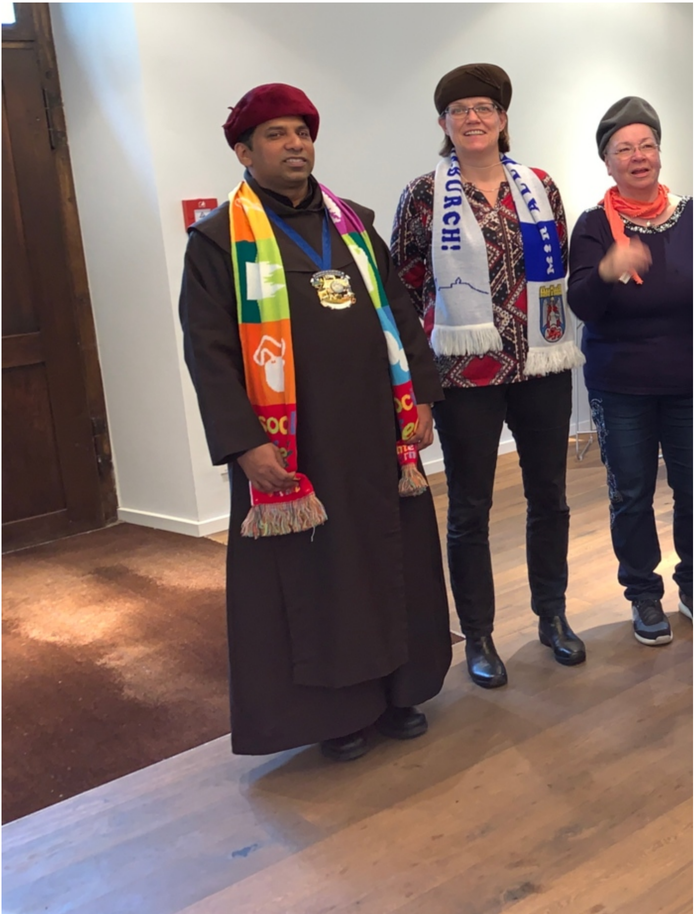
Wem steht ein Hutmodell alten Schlages am besten? Nach und nach wurden die Hüte verteilt. Statt Preisverleihung lieber ein Gruppenbild zum Abschluss.