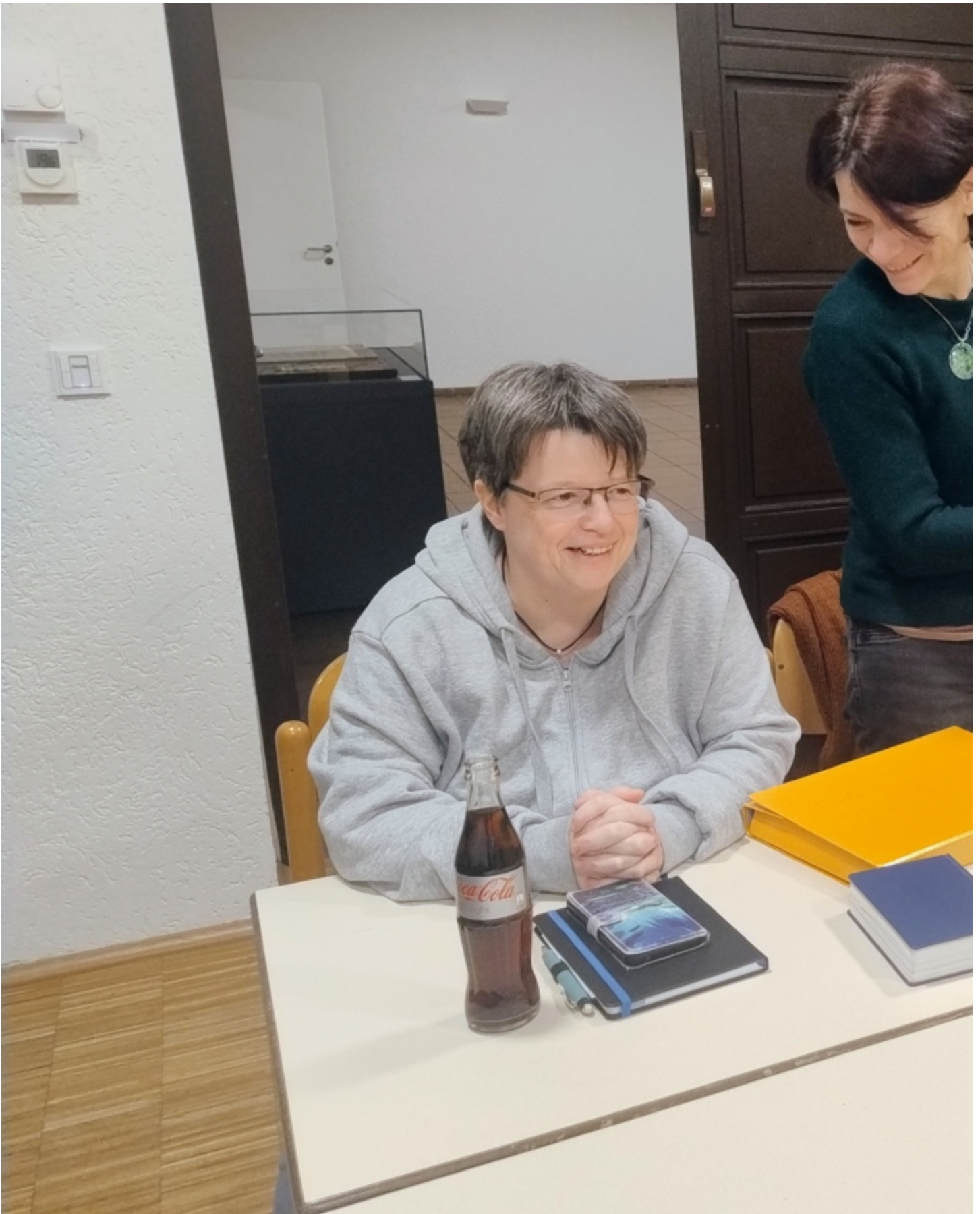
Schwerpunkte des PGR aus der Konstituierenden Sitzung im November 2025