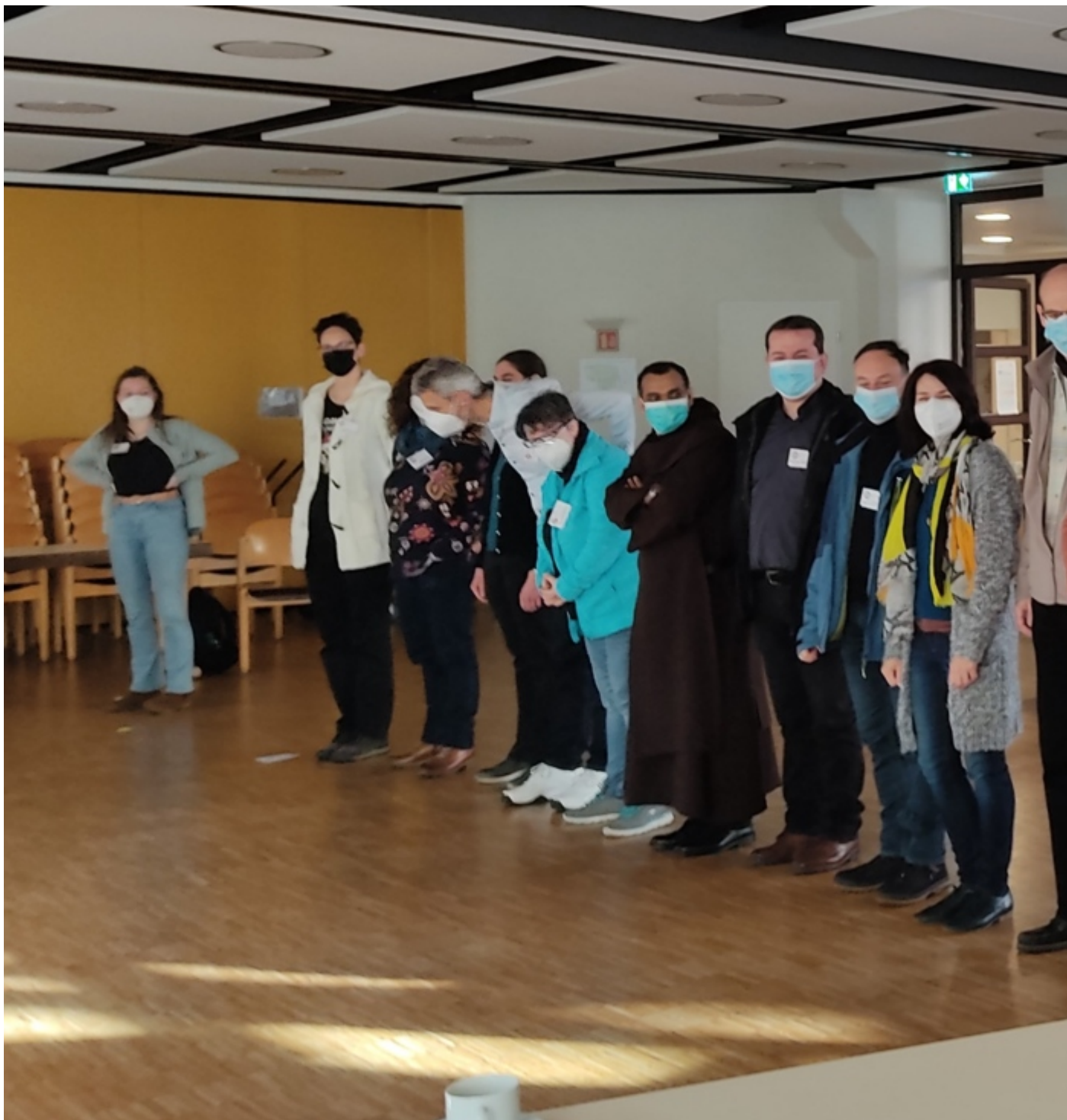
8 "neue" und 6 "alte" Mitglieder sowie 4 Seelsorger wollten sich kennenlernen. Interessant die Aufstellung nach Alter: Die Jüngste ist 18, die Älteste 60 Jahre jung.