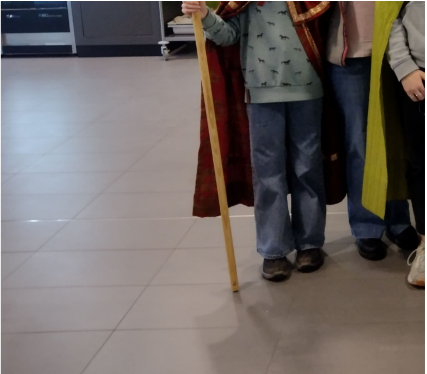
Besuch der Seniorenzentren Heinrichstraße und Friedrich-Ebert-Straße, mit sehr emotionalen Momenten bei Bewohnern und auch Sternsingern.