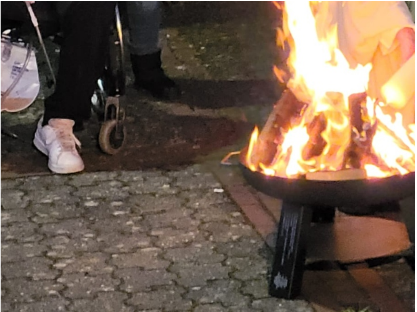
In der Osternacht am 4.4. wurde um 20.30 Uhr das Osterfeuer und die Osterkerze auf dem Kirchplatz entzündet.