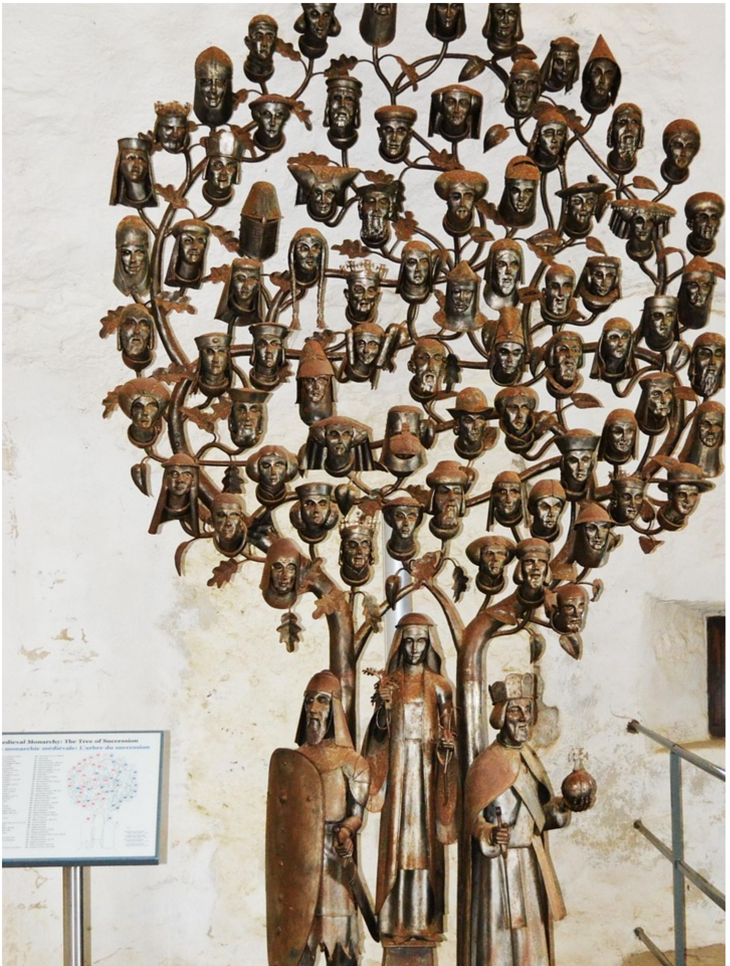
Medieval Monarchy: The Tree of Succession monarchie médiévale: L'Arbre du Successeur